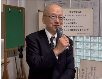
前兵庫県副知事 片山 安孝 様