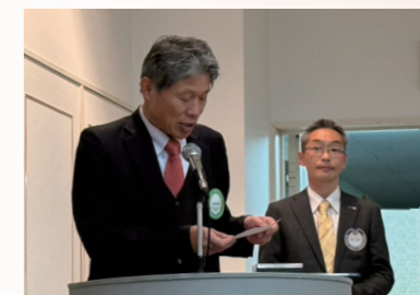
高砂RC ニコニコ報告