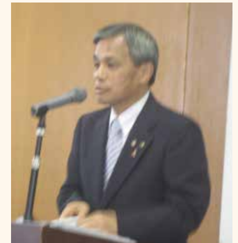
高砂市長 登 幸人様

自由度を拡大して、より一層の広域連携を促進。 産学金官民の連携によるシティリージョンも推進。