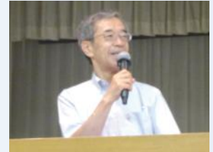
兵庫県副知事 金澤 和夫 様