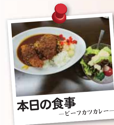
本日の食事 ビーフカツカレー