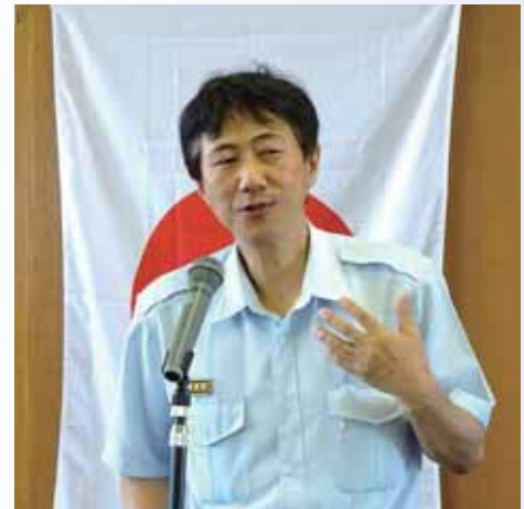
高砂市消防本部の組織