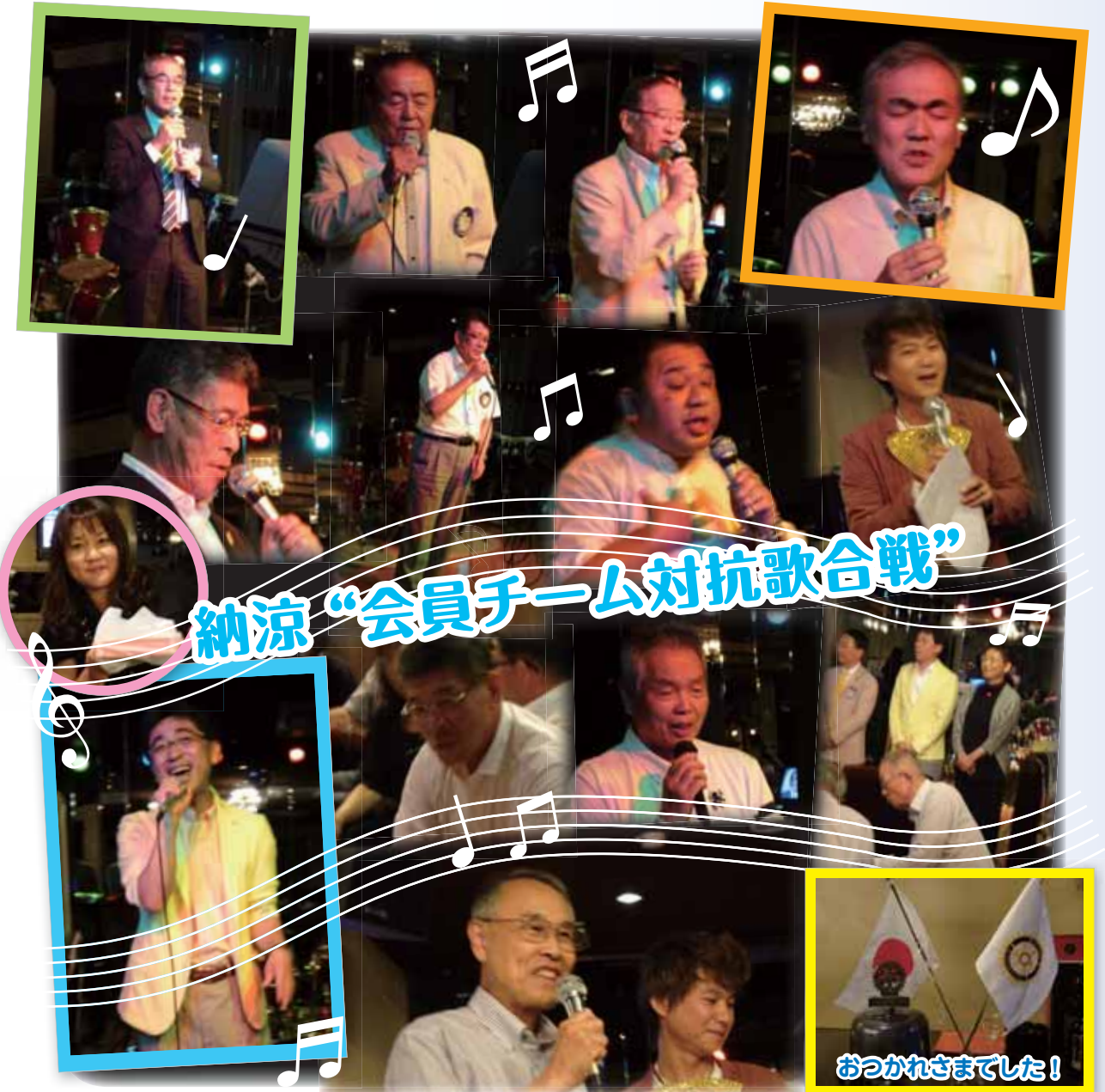
おつかれさまでした!

納涼家族例会が天山閣にて開催されました。歌合戦で残暑を吹き飛ばし、美味しいワインと食事で英気を養いました。親睦委員会の皆様、ありがとうございました。