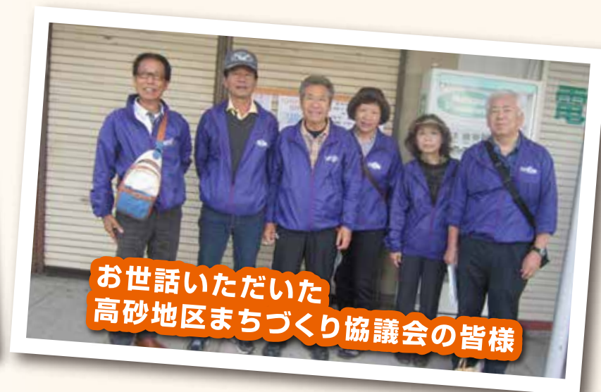
お世話いただいた 高砂地区まちづくり協議会の皆様