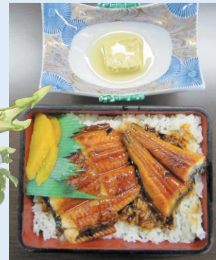
昼食メニュー うな重