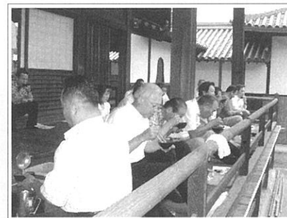
座禅修行の後、おいしい朝食を「いただきます」