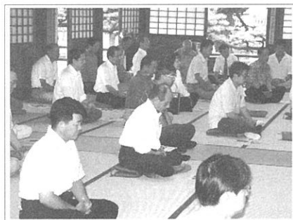
暫し静寂の空間に身を委ねるメンバーの皆さん