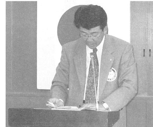
クラブ奉仕委員会 都倉副委員長