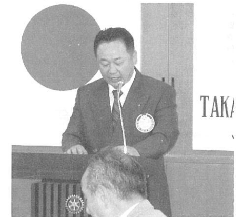
新世代委員会 中右委員長