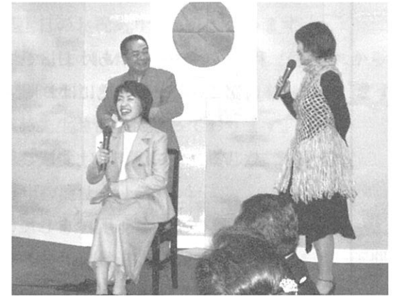
浮き世亭三吾みのる 十西中夫人